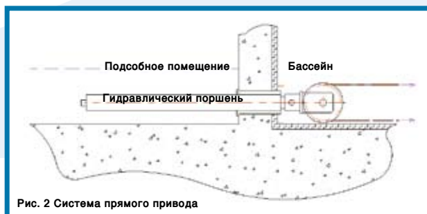
Рис. 2 Система прямого привода